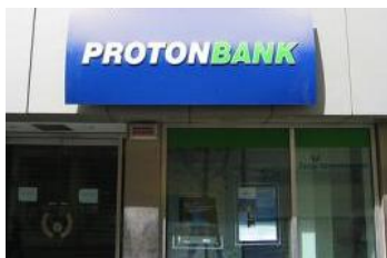
Ους η αγορά συνέζευξε... Γ.Σ. μη χωριζέτο